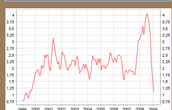
HICP – Inflation im Januar bei 1,1%

Disclaimer: Die vorstehenden Angaben stellen keine Anlageberatung dar, sondern dienen ausschließlich der Beschreibung der Finanzinstrumente bzw. Geschäfte. Eine Anlageentscheidung sollte in jedem Fall auf Grundlage des Verkaufsprospekts getroffen werden und etwaige Fragen sollten Sie mit Ihrem Bankberater besprechen. Dieser Newsletter stellt keine Kauf- bzw. Verkaufsempfehlung für ein bestimmtes Wertpapier oder Produkt dar. Leser, die aufgrund der in diesem Newsletter veröffentlichten Inhalte Anlageentscheidungen treffen, handeln auf eigene Gefahr. Die hier veröffentlichten oder anderweitig damit im Zusammenhang stehenden Informationen begründen keinerlei Haftungsobliegenheit. Alle Meinungsäußerungen geben die aktuelle Einschätzung der IG Börse Dresden e.V. wieder, die ohne vorherige Ankündigung geändert werden kann. Obwohl die vorstehenden Angaben Quellen entnommen wurden, die als zuverlässig erachtet werden kann für deren Richtigkeit, Vollständigkeit und Angemessenheit keine Gewähr übernommen werden. Aus der Wertentwicklung in der Vergangenheit kann nicht auf zukünftige Erträge geschlossen werden.